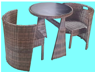
组合使用状态参考图